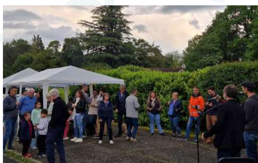
Repas de quartiers