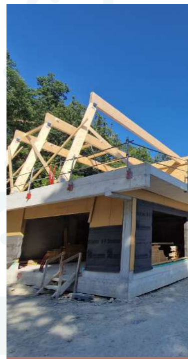
Travaux du pôle de pratique