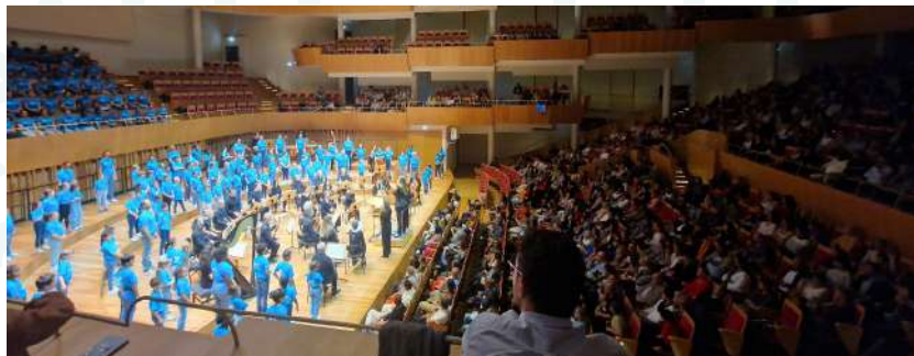
Concert DEMOS avec la participation de l'Art de la Fugue