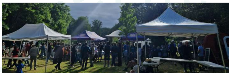
Festival intercommunal Jazz 360, étape à Latresne par l'association Jazz 360