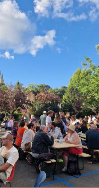
esne en fête par omité des fêtes