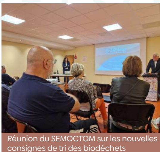
Réunion du SEMOCTOM sur les nouvelles consignes de tri des biodéchets