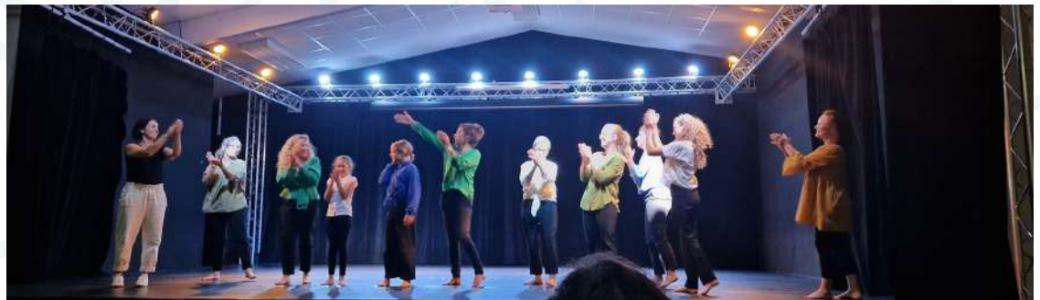
Restitution du projet culturel intergénérationnel du CCAS