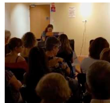
Parlez moi de musique à la médiathèque