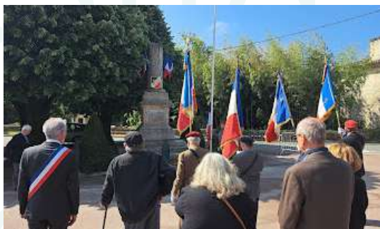
Commémoration du 8 mai 1945