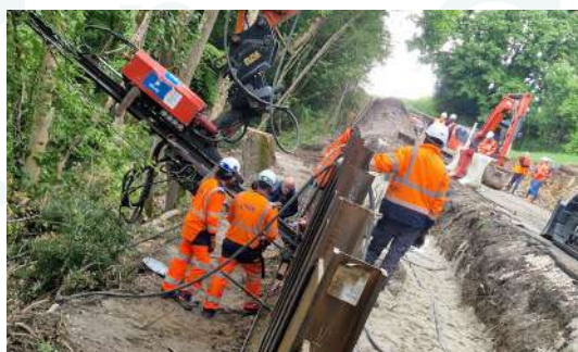
Travaux rte de Cénac