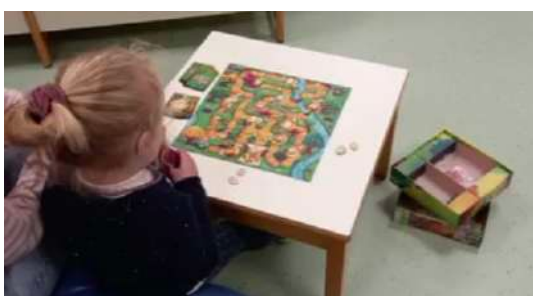
Jeux des tous petits à la médiathèque