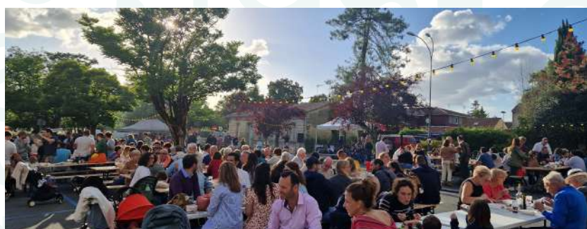
Latresne en fête par le Comité des fêtes