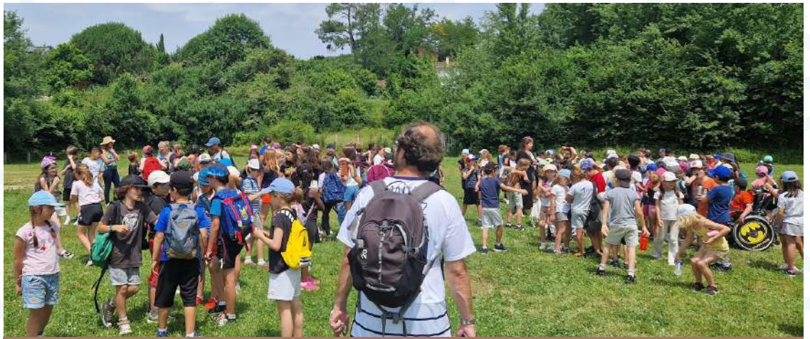
Pique-nique des écoles