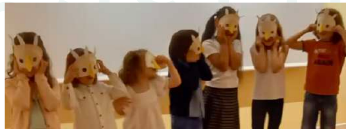
Histoires en musique à la médiathèque