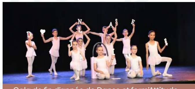
Gala de fin d'année de Danse et form'Attitude