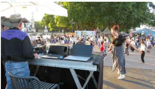
Les Eagles dancers animent Dansons sur les quais