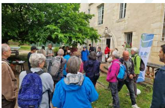
Journée éco-citoyenne par le Conseil participatif