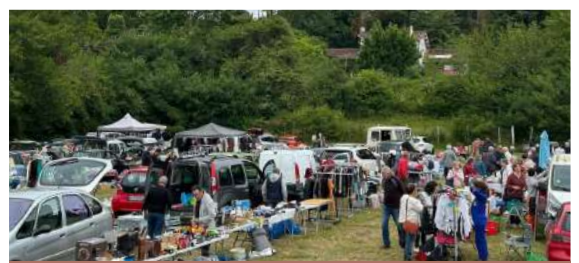
Vide grenier par le comité des fêtes