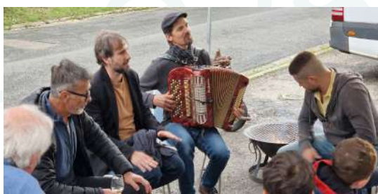
Repas de quartiers