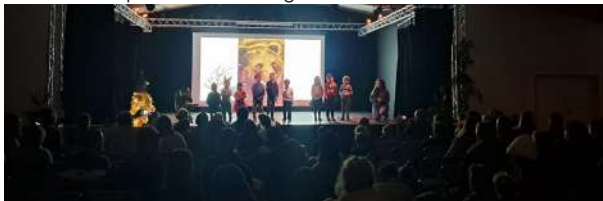
La médiathèque et l'Art de la Fugue fêtent Noël