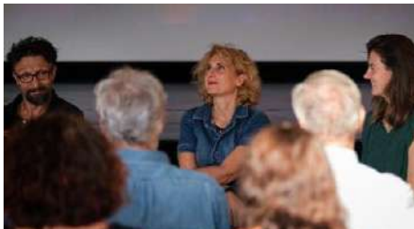
Rentrée à Latresne : conférence de rentrée