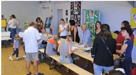
Rentrée à Latresne : forum des associations