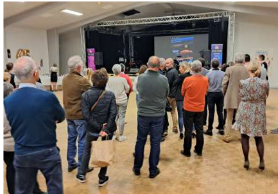
45 ans de l'association Danse et Form'Attitude