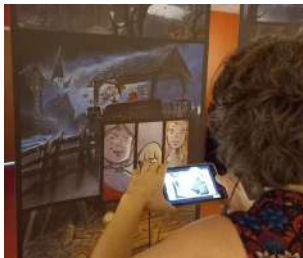
Animations dans le cadre du Festival Vitabib