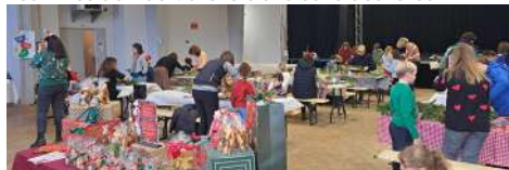
Festivités de Noël : ateliers à la salle des fêtes