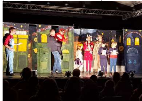
Festivités de Noël : spectacle familial