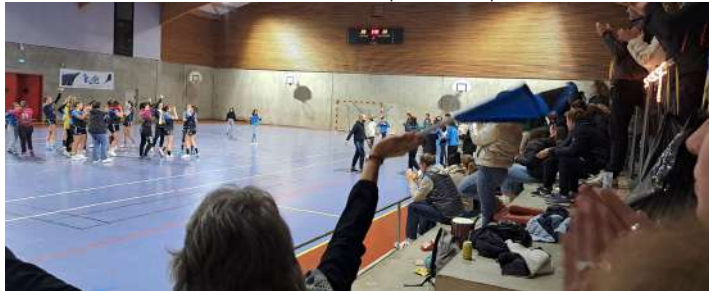
Victoire du match sénior féminine handball pe2m - coupe de France