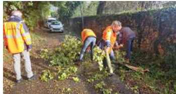
Intempéries automne 2023