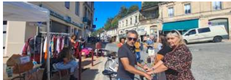
Latresne en fête : braderie avenue de la Libération