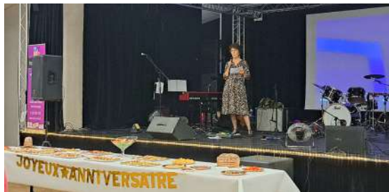
Fête de l'automne