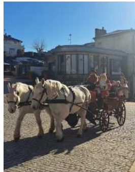
Festivités de Noël sur le marché